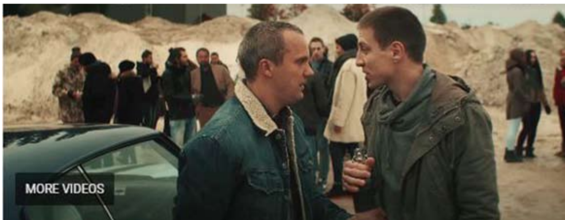
Prieš aštuonerius metus apleistame kvarcinio smėlio karjere buvo filmuojamas kino filmas „Traukinio apiplėšimas, kurį įvykdė Saulius ir Paulius“.

Šalia Anykščių miesto, buvusiuose kvarcinio smėlio karjeruose, Anykščių rajono savivaldybė planuoja suprojektuoti infrastruktūrą gynybos ir saugumo miesteliui įkurti. Apie tai informacija skelbiama Anykščių rajono savivaldybės Bendrojo ir ūkio skyriaus specialistų parengtoje techninėje specifikacijoje parengti monomineralinio kvarcinio smėlio rekultivavimo darbų projektą.