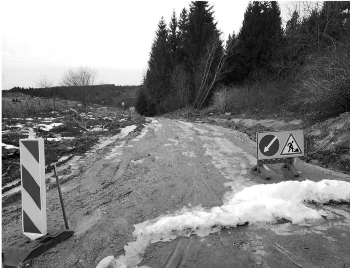
Kol kas Elmos gatvės rekonstrukcijos darbai yra sustoję.

Anykščiuose rekonstruodama Elmos gatvė, Anykščių rajono savivaldybė susidūrė su problemomis. Gatvę projektavusi mažoji bendrija „Susisiekimo komunikacijų sprendimai“ dalį jos suprojektavo miško teritorijoje, kurioje gatvės apskritai nėra.