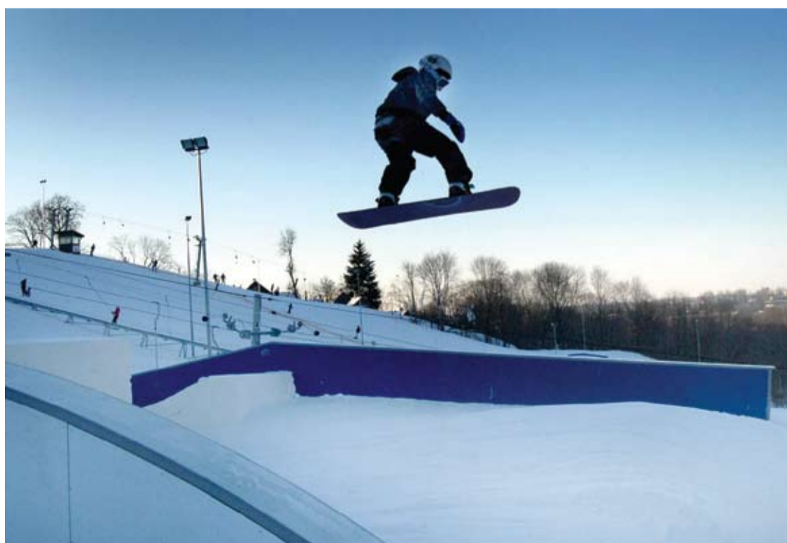
Slidinėjimo sezonas ant Kalitos kalno prasidėjo pernai gruodžio pradžioje ir tęsėsi iki šių metų vasario 26 dienos.