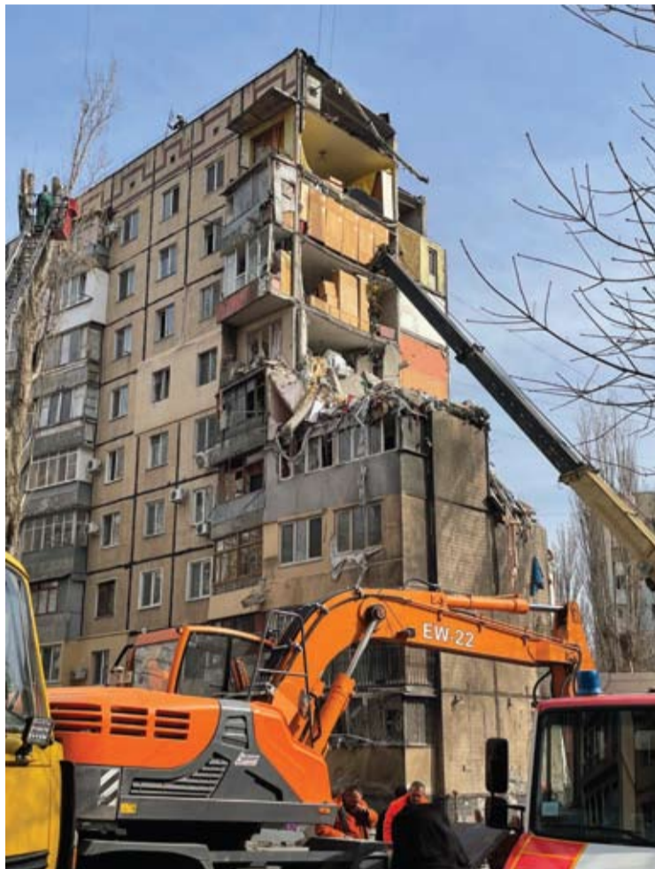
Rusijos dronas pražudė žmonės šiame name.

Įvykio vietoje užkalbintas Odesos meras Genadijus Truchanovas neslėpė įtūžio saky-